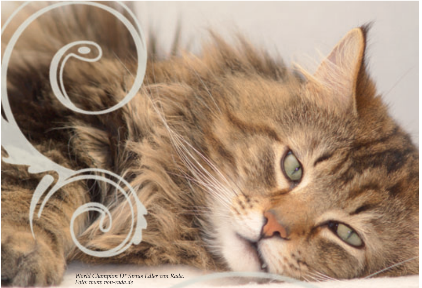
World Champion D* Sirius Edler von Rada.